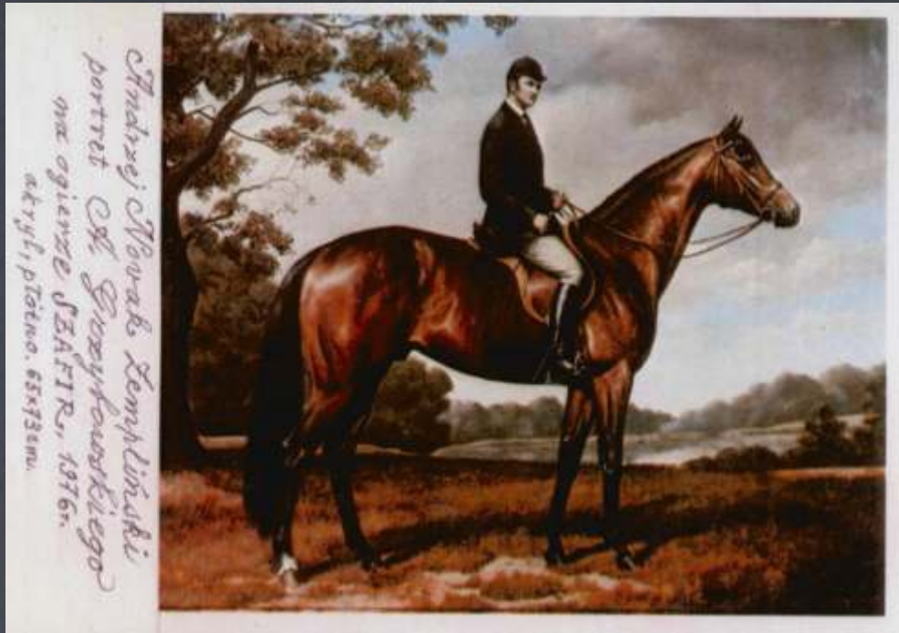
Andrzej Nowak-Zempliński Portret A. Grzybowskiego na ogierze Szafir 1976 r. akryl, płótno, 65x73cm