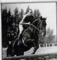
Ogier OKAP pod A. G. P. S. G. L. psch. 1961r.

ul. Kwowska 11m.5 Pl. 00 660 Warszawa tel. 48 222 621 02 05