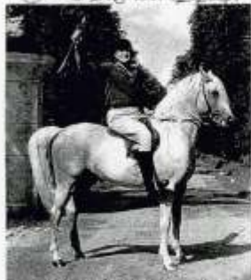
og. SEDAN, og. pod A. G. Janów Polski, 1967r.

Pl-00-660 Warszawa, 75 VII Złotowska 11 m 5 3020 tel. *48 (22) 621 82 83