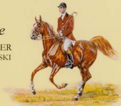
Portret Andrzeja Grzybowskiego w agencji Owece, malował Stanisław Gepner.