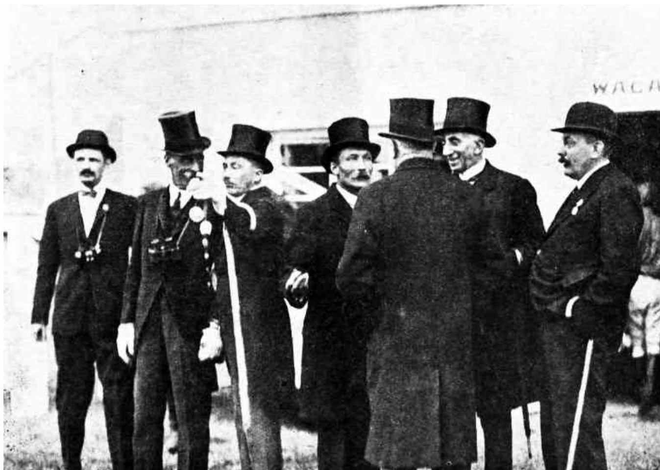
Z UROCZYSTOŚCI LWOWSKICH.

Publiczności było moc, zainteresowanie i przejęcie się panowało ogromne, ale nie wśród uczestników i ludzi zainteresowanych bliżej co do sytuacji szampionatu, bo wynik był jasny: trudno było przypuszczać, by na tym lekkim parcours'ie flolendrzy mieli zmienić pierwszą lokatę na inną. Najwyżej mogli odpaść Norwedzy, u których jeden koń, choć dopuszczony przez komisję, najwidoczniej miał ostrą kulawiznę złagodzoną przez jakiś narkotyk. Prawda, skacząc, zrobił 12 p. k., ale to postaci rzeczy nie zmieniło.