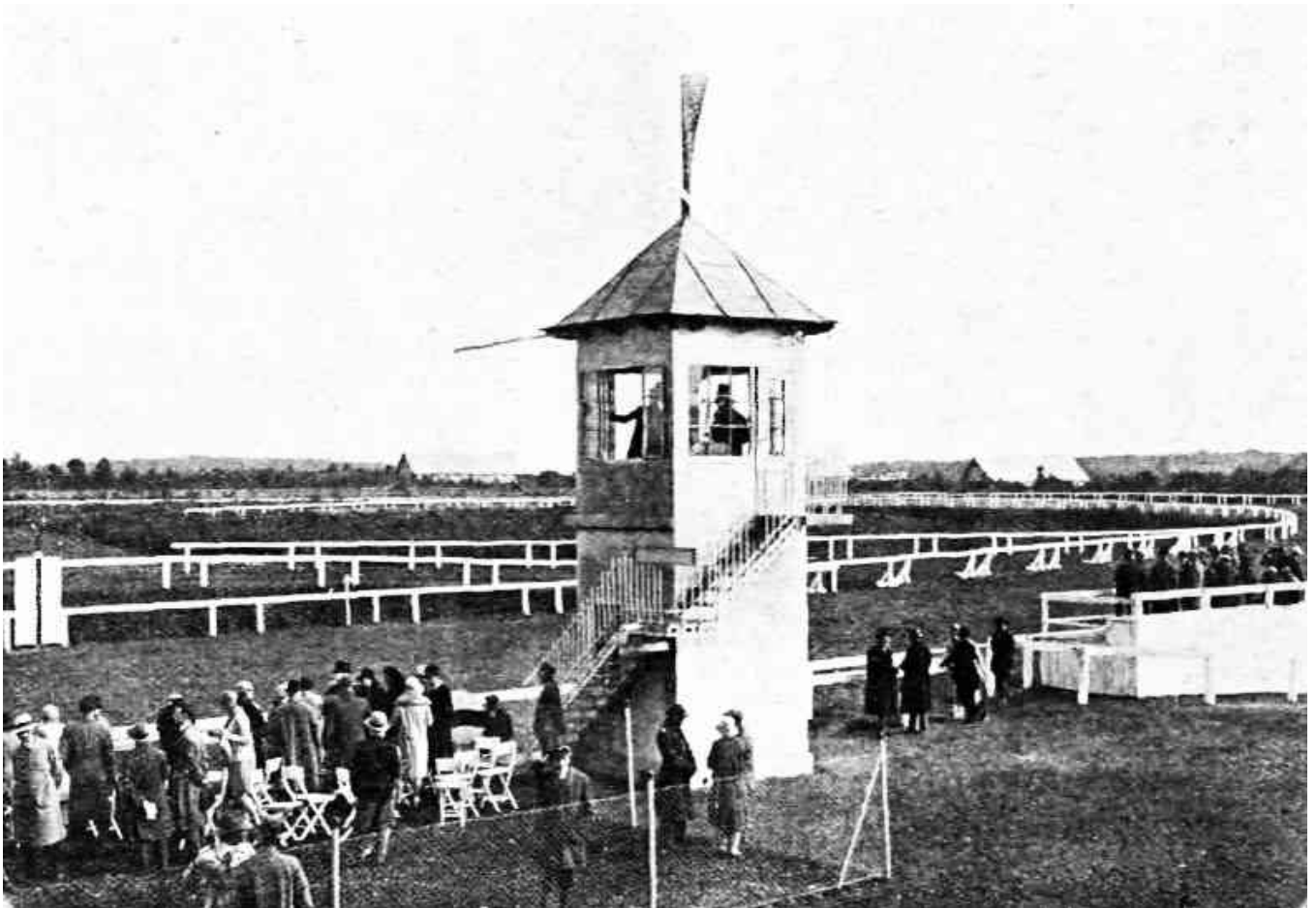
NOWY TOR WYŚCIGOWY WE LWOWIE. Ogólny widok z budką sędziowską na pierwszym planie.

Przed zamknięciem Igrzysk megafon ogłosił, iż następną, X-tą Olimpiadą 1932-go roku odbędzie się w Los Angeles.