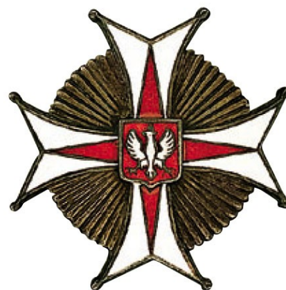
Odznaka pułkowa 22 Pułku Ułanów Podkarpackich.