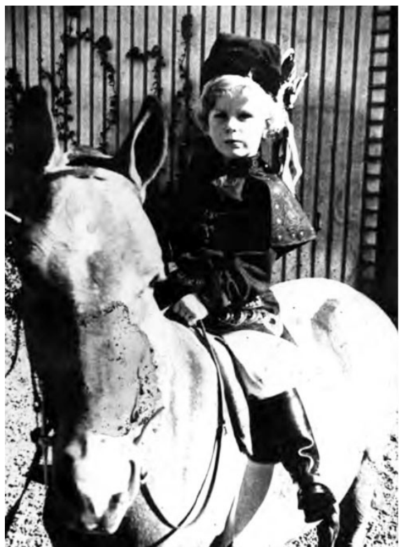
20. Stanisław Potocki na Fidze.

„[...] ojciec uważał - wspomina - że chłopcy nie powinni jeździć na kucach. Moim instruktorem był dawny sierżant kawalerii, który pracował u nas jako pomocnik rządcy majątku pana Dąbrowskiego. Mój wierzchowiec nazywał się Piorun, co było przesadą, ponieważ cechowała go wielka łagodność. Pamiętam, że czułem się na nim zupełnie bezpiecznie, choć robił na mnie wrażenie jego wzrost.”