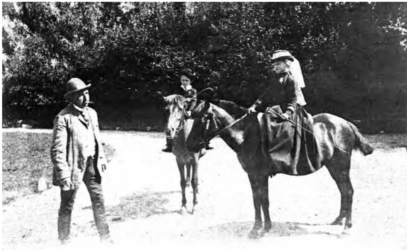
6. Dzieci na kucach.

Jak widzimy, był to trening, choć bezwzględny, to pokonujący lęki dziecka ze śmiechem.