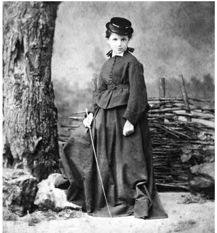
5. Amazonka. Fot. archiwalna. Muzeum-Zamek w Łańcucie.