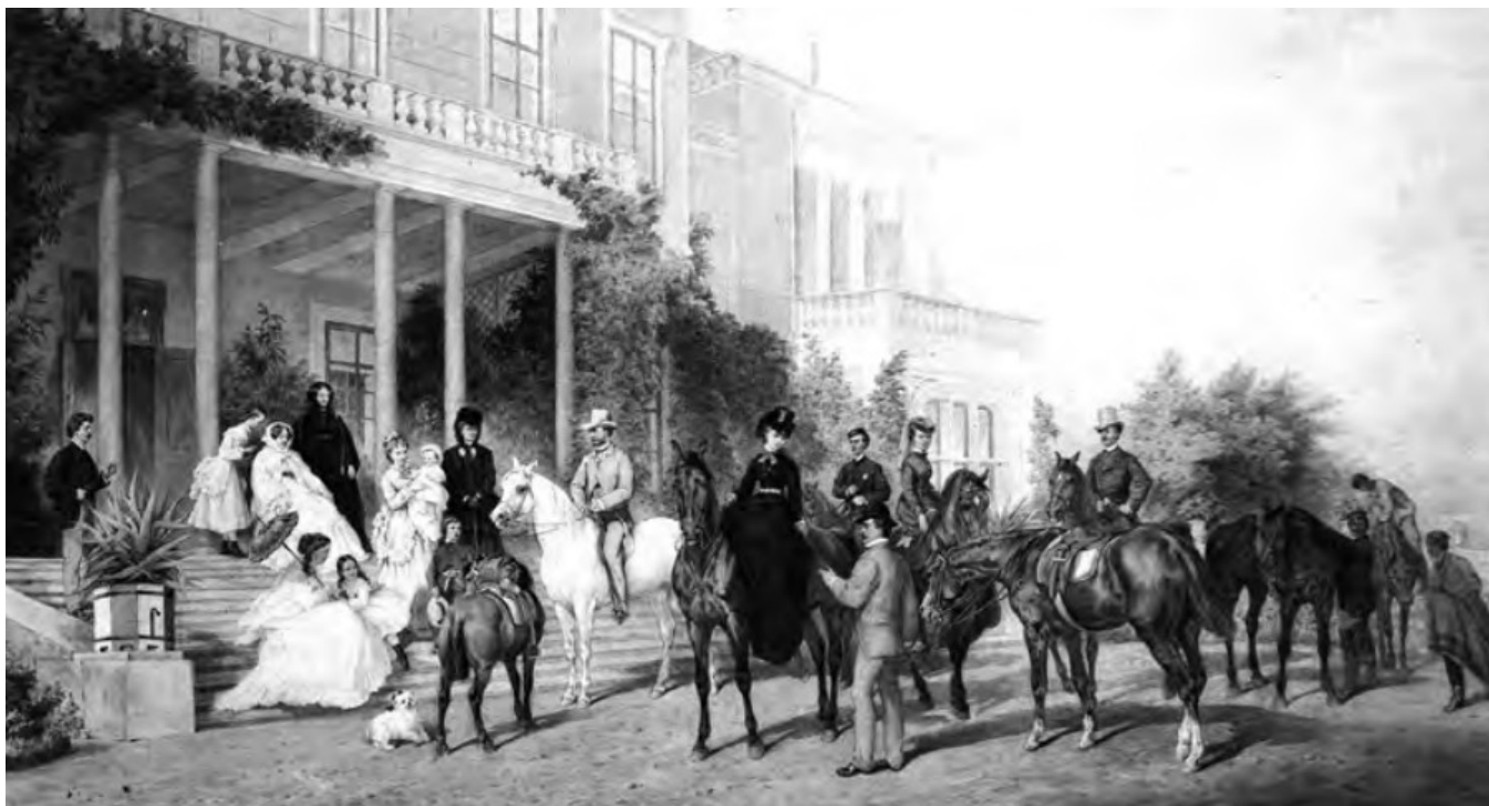
12. Wyjazd na spacer w Krzeszowicach, Juliusz Kossak, 1872. Muzeum Narodowe w Warszawie.