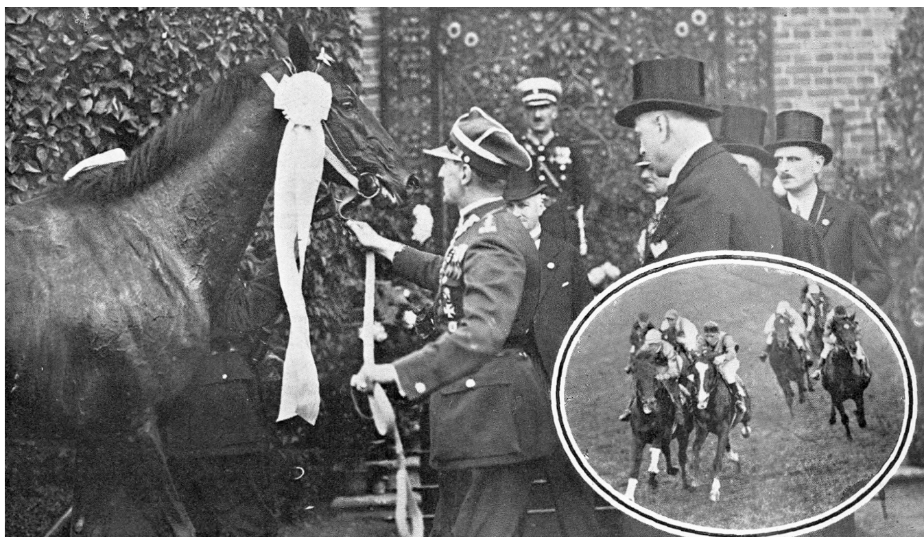
Derbista Wisus, po udekorowaniu błękitną wstęgą r. 1933 przez Prezesa T-wa Zach, do Hod. Koni w Polsce.

Tak dobrych koni jak w tegorocznym Derby nie widzieliśmy już dawno. Stawka była niezbyt liczna, ale doskonale dobrana i wartościowa.