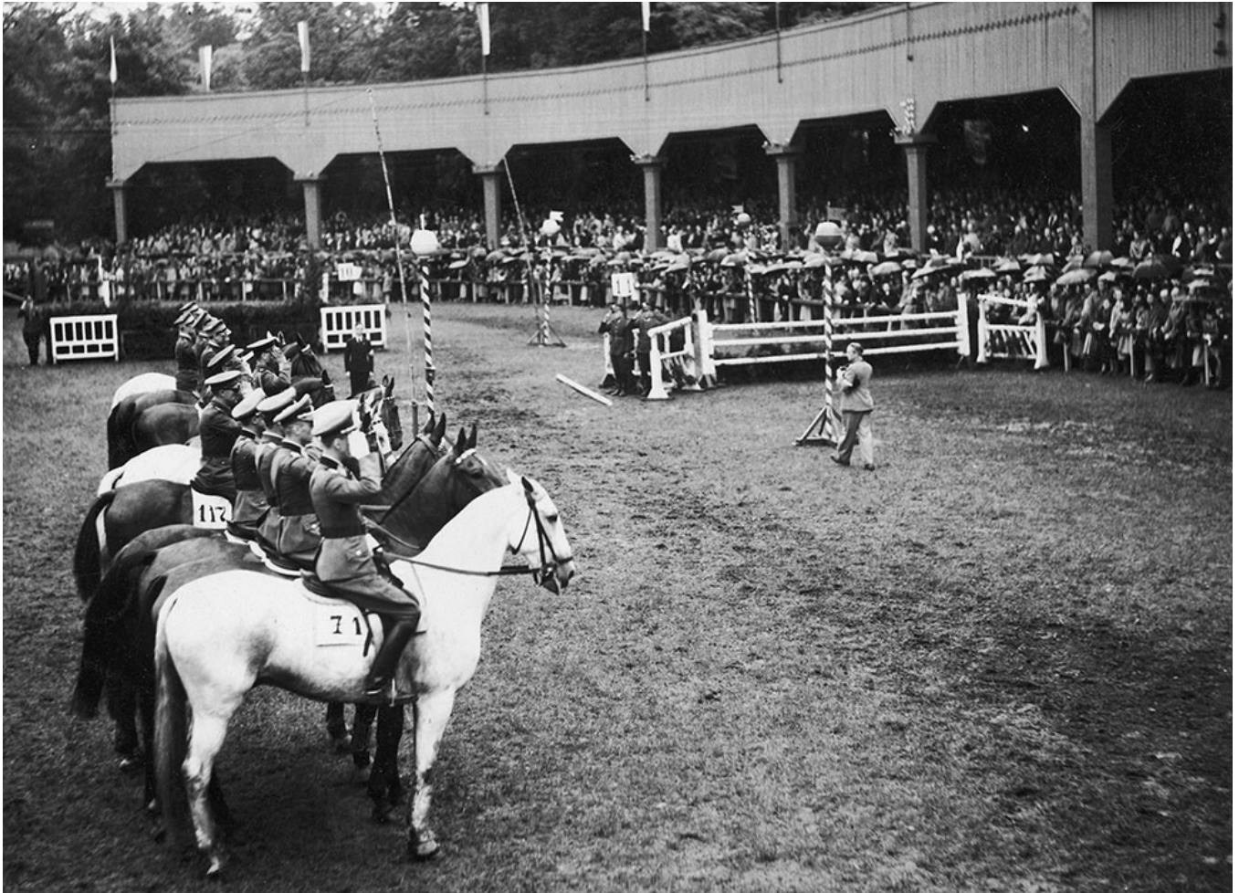
Prezentacja ekip jeździeckich przed Pucharem Narodów.

Sprzed pierwszej wojny światowej pozostał sportowy stadion w Parku Sobieskiego, wybudowany w 1900 r. przez Towarzystwo Wyścigów, na którym rozgrywano konkursy hipiczne w latach 1901-1914. Po wojnie konkursów tam już nie wznowiono, a teren zajęły inne organizacje sportowe. Gdy więc zaczęła dojrzewać koncepcja zbudowania w Warszawie stadionu dla międzynarodowych konkursów hipicznych — początkowo chciano uczynić to na starym miejscu w Parku Sobieskiego.