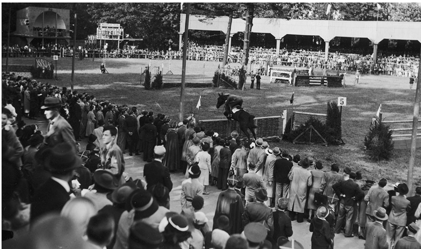
Międzynarodowe Zawody Hippyczne na hipodromie w Łazienkach Królewskich w Warszawie.

Jeźdźcy nasi, biorąc w latach 1923-1926 udział w licznych międzynarodowych zawodach konnych w wielu krajach Europy i w Ameryce, odczuwali ogromnie potrzebę zorganizowania międzynarodowych zawodów również i w Polsce. Wskazane to było po pierwsze jako rewanż za doznaną gościnę w obcych krajach, gdzie całkowity koszt pobytu ekip, a przeważnie i przejazdy drużyn pokrywały komitety organizacyjne imprez, a po wtóre ze względów polityczno-prestiżowych, aby Polska w dziedzinie sportu stała na równi z innymi krajami.