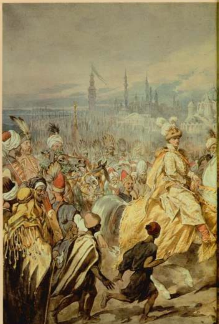
JULIUSZ KOSSAK "Wawrzyniec Fredro w poselstwie do Stambułu" Muzeum Narodowe w Warszawie

Od kilkuset lat konie arabskie przyprawiano do Europy z pustyni Środkowego Wschodu. Najpierw trafiły z Maurami do Hiszpanii. Potem po wyprawach do Palestyny i Syrii przyprowadzili je krzyżowcy. Zalety tych koni ceniono wysoko i potem sprowadzano je już drogą zwykłej wymiany handlowej.