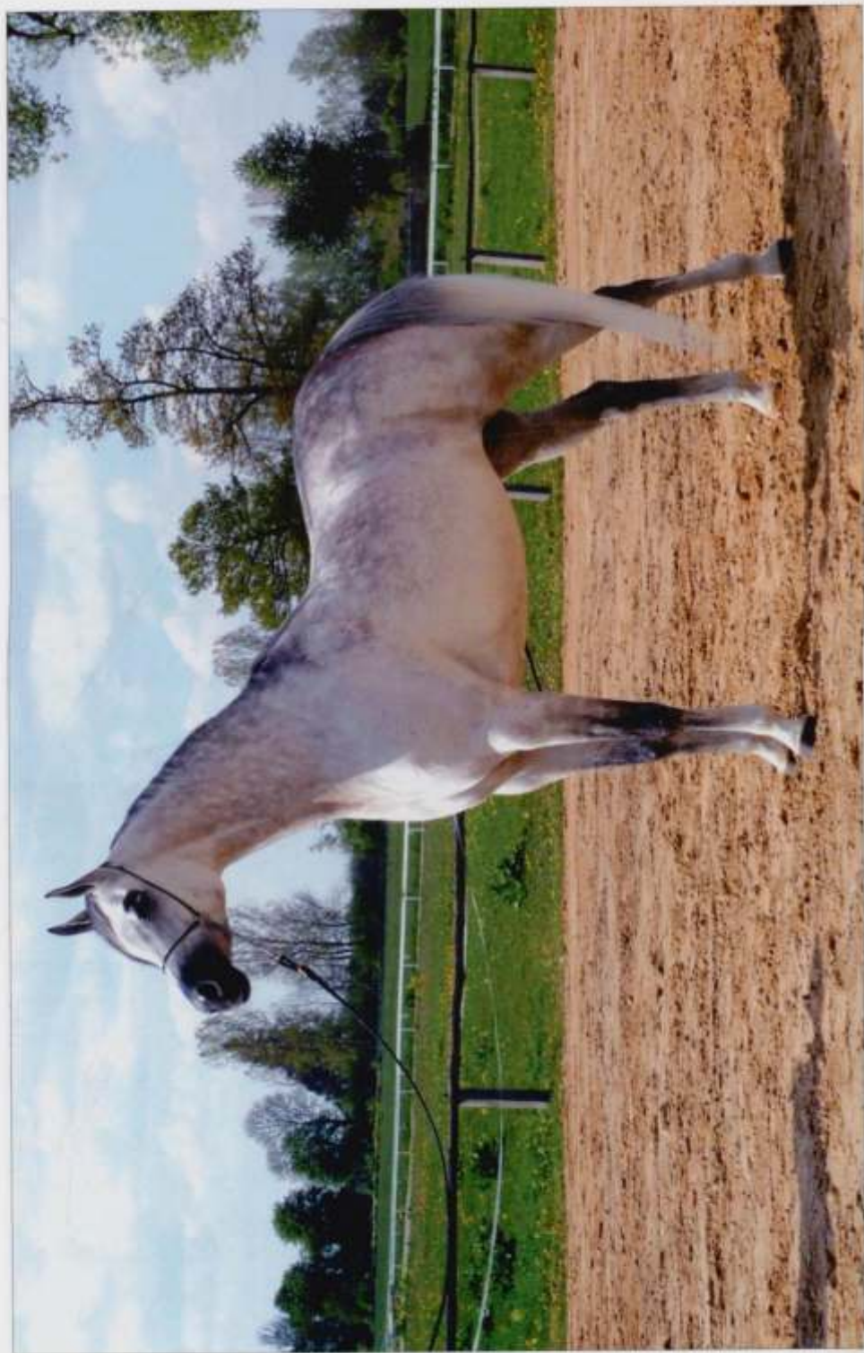
12. kl. Perfinka s. 2011 (Esparto – Perfirka po Gazal Al Shaqab), hod. SK Białka