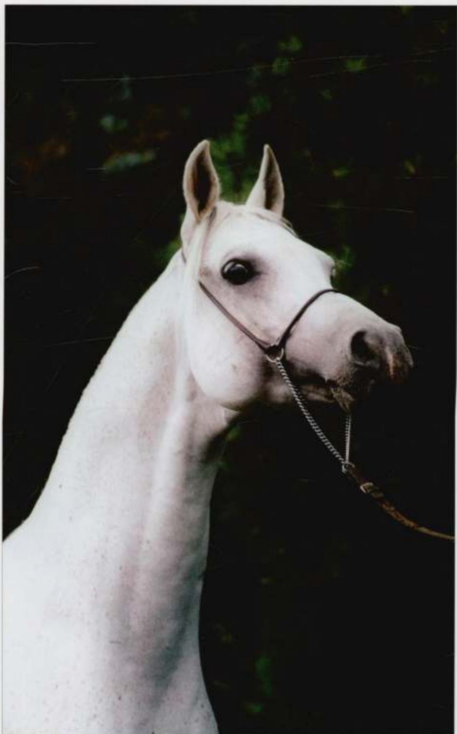
4. og. Emigrant s. 1991 (Ararat – Emigrantka po Eukaliptus), hod. SK Michałów