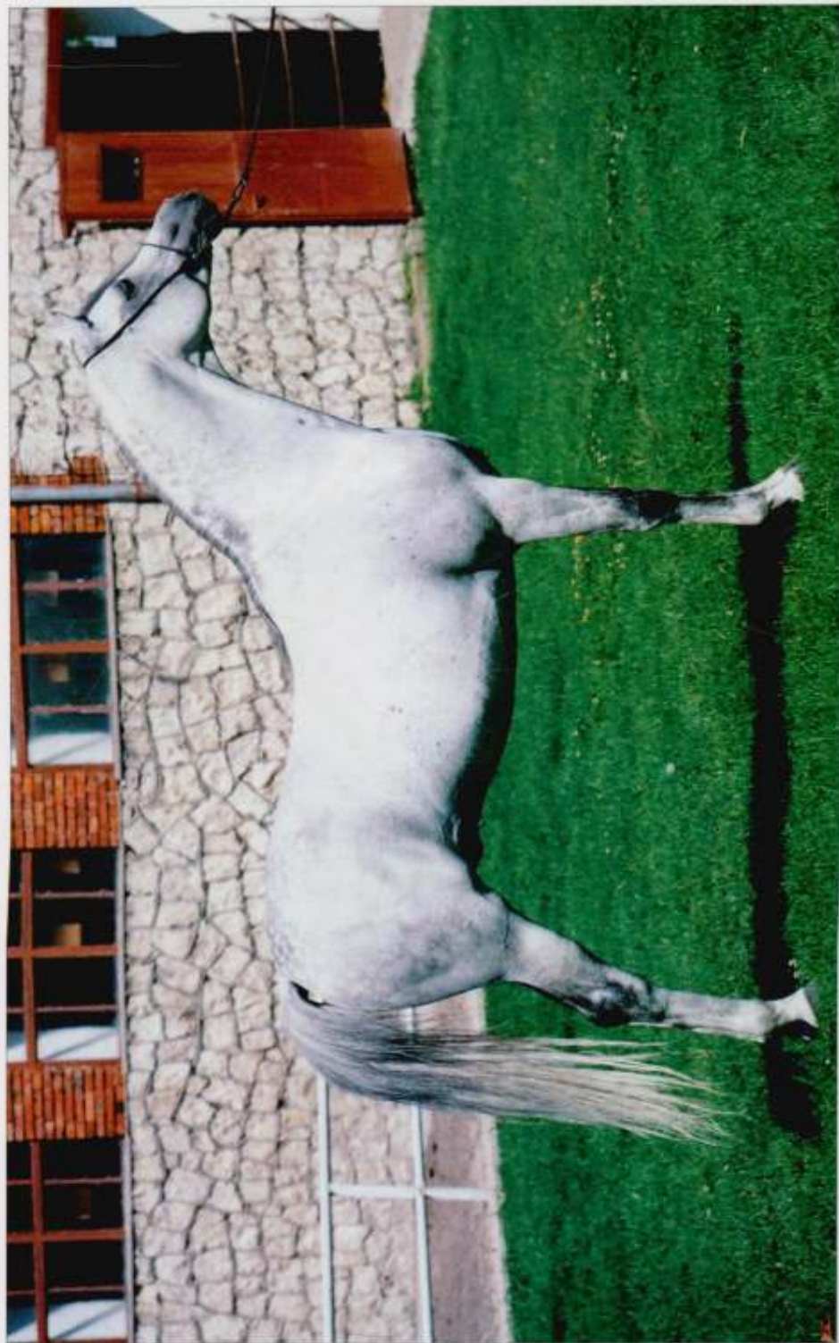
6. og. Ekstern s. 1994 (Monogramm – Ernestyna po Piechur), hod. SK Michałow, fot. Patrycja Umińska