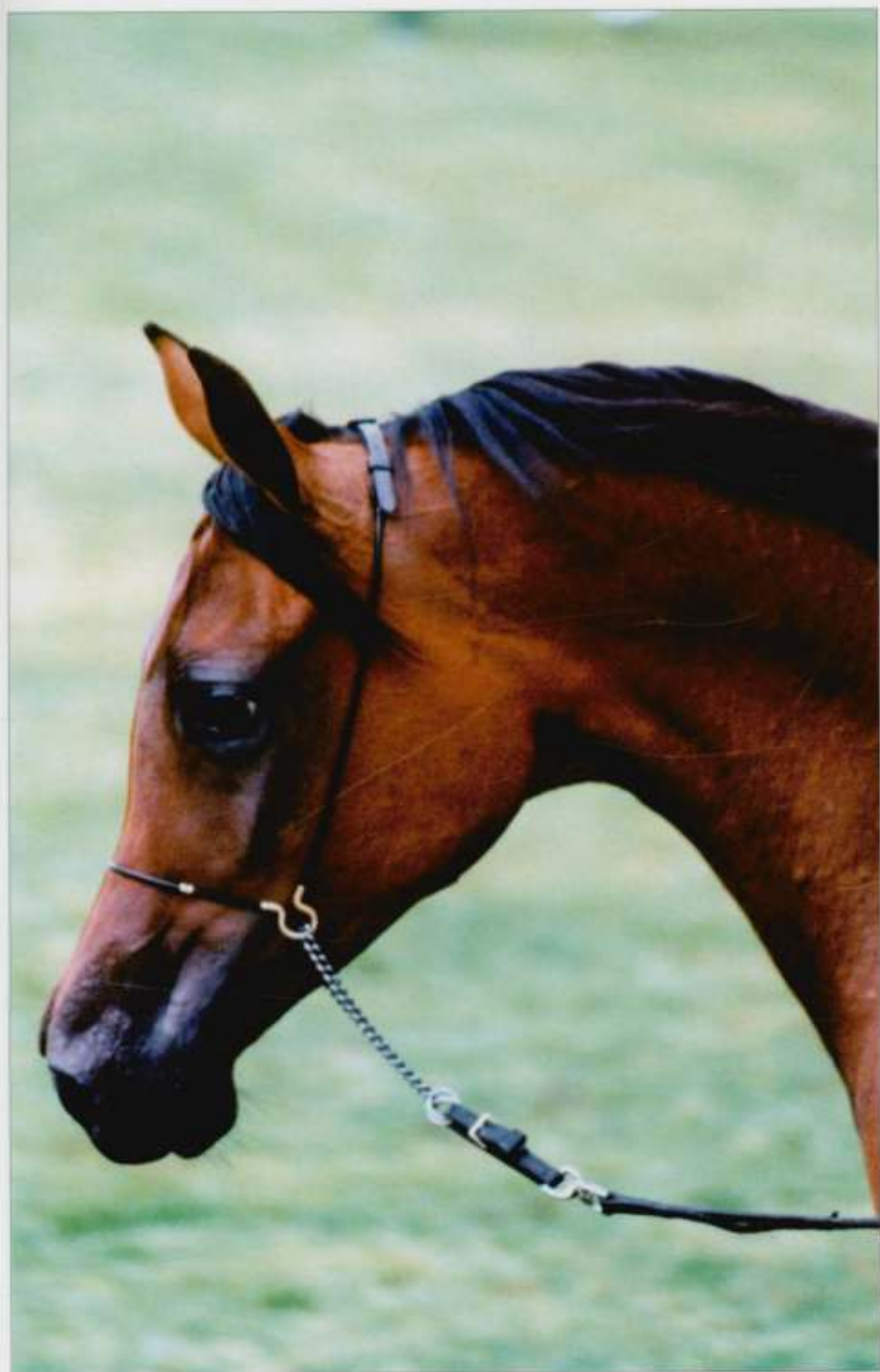
9. kl. Pianosa gn. 1998 (Eukaliptus – Pinią po Probat), hod. SK Janów Podlaski