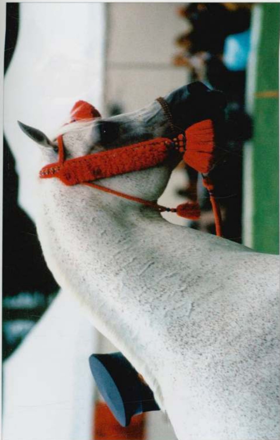
1. og. Eukaliptus s. 1974 (Bandos - Eunice po Comet), hod. SK Janów Podlaski, fot. Patrycja Umińska