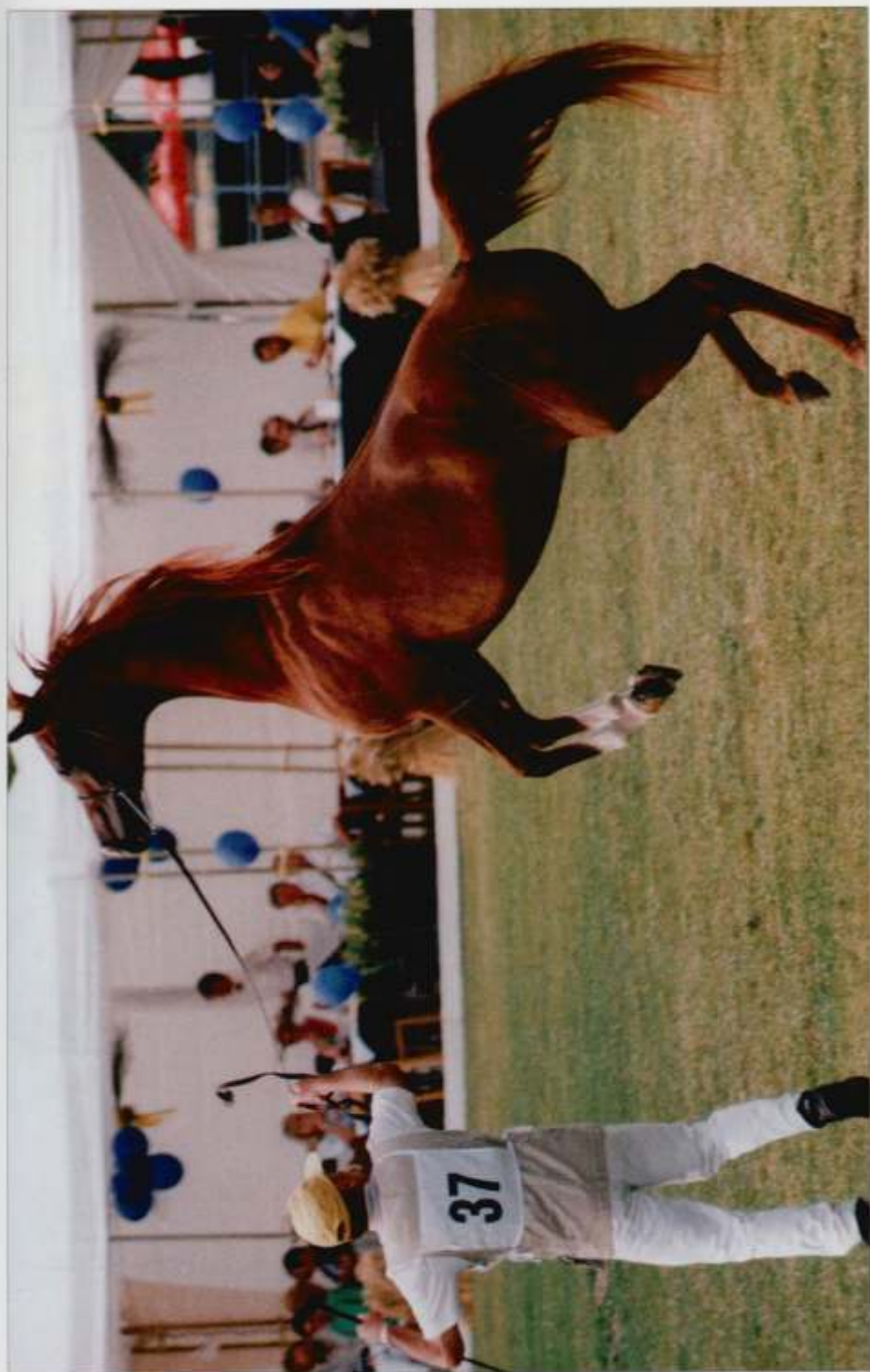
7. kl. Kwestura kaszt. 1995 (Monogramm – Kwesta po Pesennik), hod. SK Michałów, fot. Patrycja Umińska