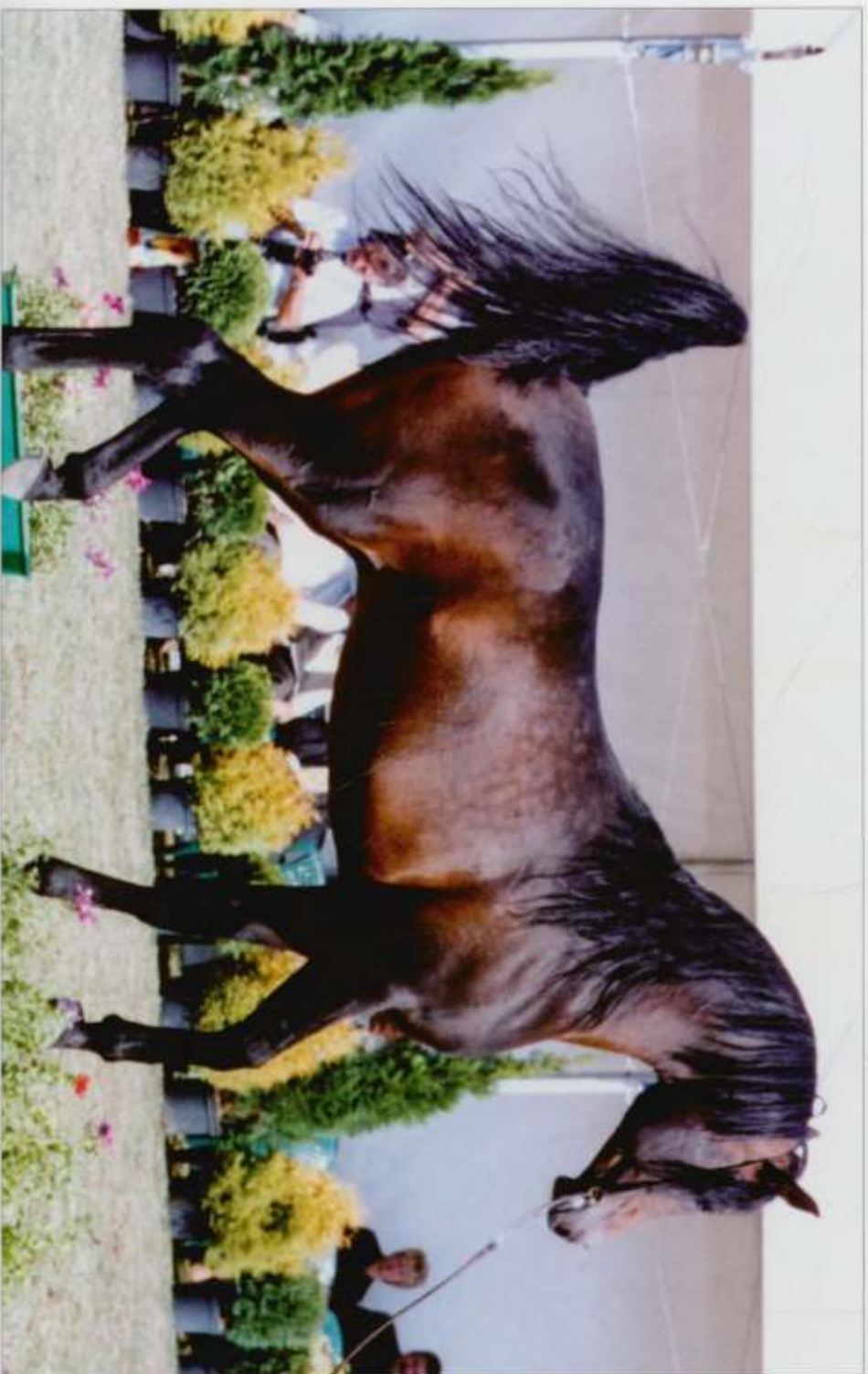
8. og. Gazal Al Shagab gn. 1995 (Anaza El Farid – Kujora po Kabort), hod. Al Shagab Stud,QA