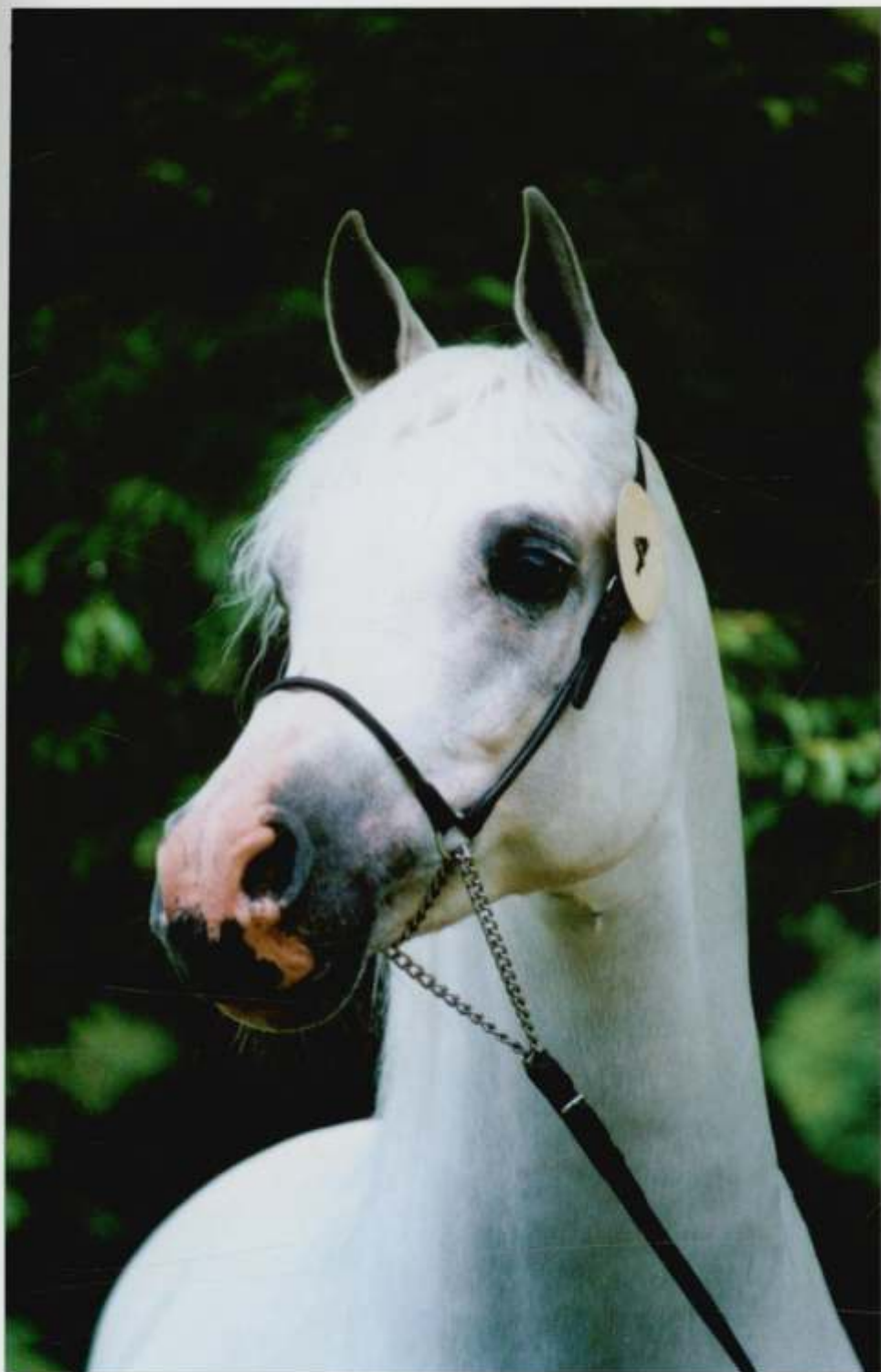
5. og. Pesal s. 1991 (Partner – Perforacja po Ernal), hod. SK Białka