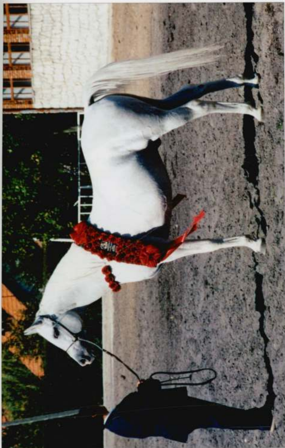
3. og. Eldon s. 1985 (Penitent – Erotyka po Eufrat), hod. SK Michałów, fot. Patrycja Umińska