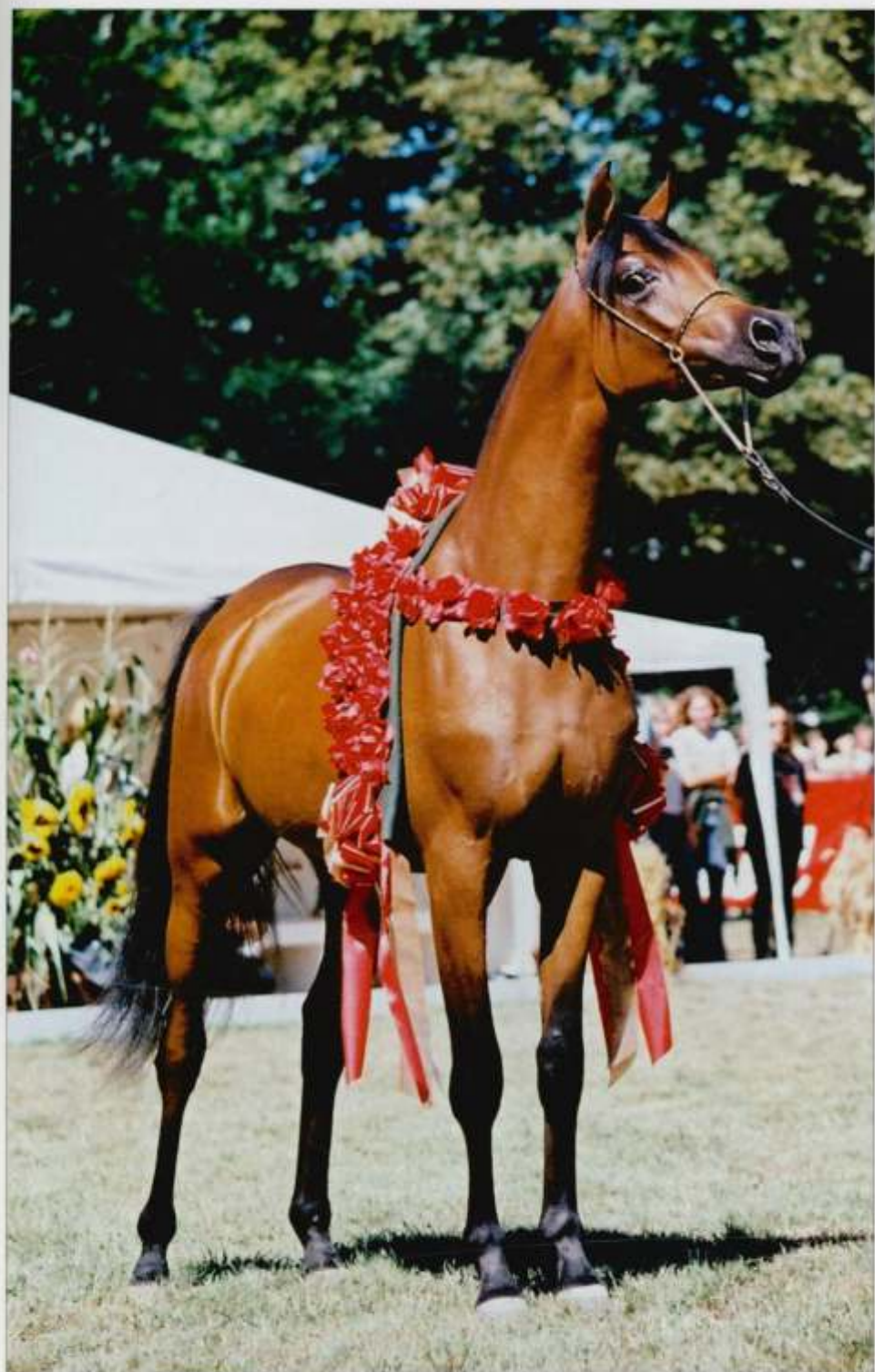
11. kl. Pianissima gn. 2003 (Gazal Al Shaqab – Pianosa po Eukaliptus), hod. SK Janów Podlaski