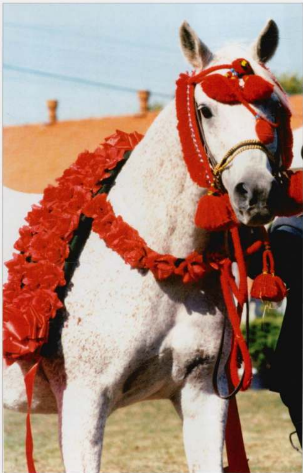
2. kl. Emigracja s. 1980 (Palas – Emisja po Carycyn), hod. SK Michałów