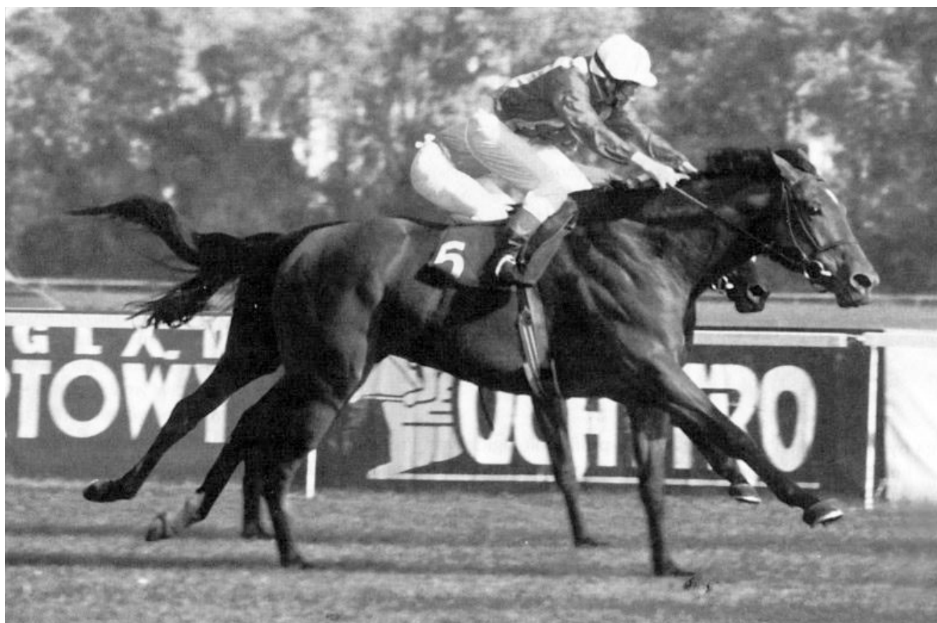
Finisz, Nagroda Mosznej.

Sezon wyścigowy ze względu na złe warunki atmosferyczne rozpoczął się 27 kwietnia, prawie o miesiąc później niż planowano (31.03.). Przez 4 miesiące tor był zamrożony i tylko nieliczni trenerzy ryzykowali kentrując, pozostali klusowali najczęściej na kółkach przy stajniach. Warto przypomnieć, że do 1972 roku wyścigi rozpoczynały się na początku maja; w latach 1972-86 po 20 kwietnia, a dopiero w ostatnich latach łżejsze zimy pozwoliły na rozpoczynanie wyścigów na początku kwietnia, a nawet w końcu marca.