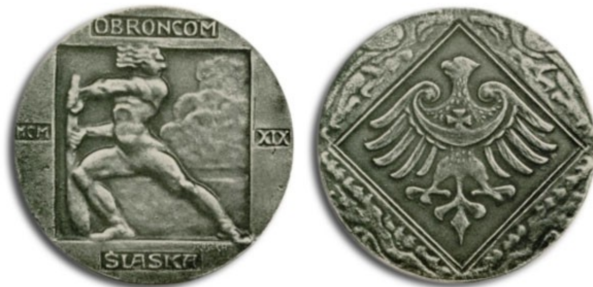
A: Nagi wojownik z maczugą w rękach. R: Orzeł śląski. Medal wydany dla upamiętnienia pierwszego Powstania Śląskiego.