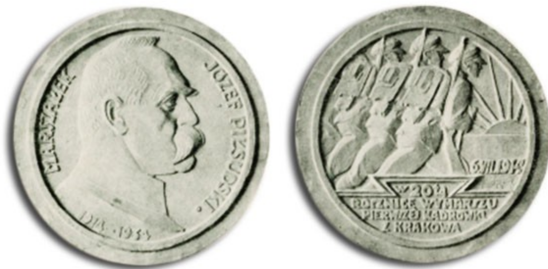
XX rocznica wymarszu pierwszej kadrówki Legionów z Krakowa. Projekt medalu, gips, 195 mm, 1934.

III 1939 do tamtejszego Komitetu Uczczenia Pamięci Marszałka Józefa Piłsudskiego przesłano modele gipsowe. Wg małego modelu Józef Piłsudski na koniu, brąz, 1938 (z projektu na pomnik warsz., wł. pryw. w Krakowie) wzniesiono pomnik Piłsudskiego w Lublinie, odsłonięty 10 XI 2001 (posąg - brąz, cokół - granit; model realizacyjny wyk. rzeźbiarz Krzysztof Skóra z Chełma, 2001).