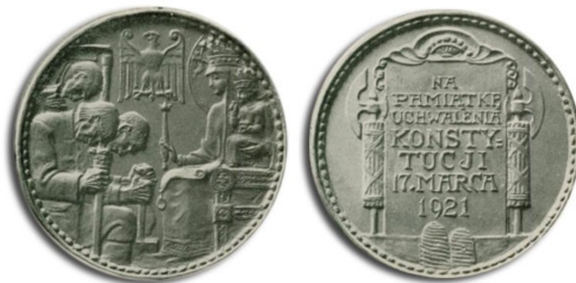
Medal wydany dla upamiętnienia uchwalenia Konstytucji z 1921 r.

(konkursowa wystawa „Rzeźba pol.”), 1933 (dwukrotnie, w tym konkursowa wystawa „Rok 1920”), 1935 (Salon jubileuszowy); inne wystawy w Warszawie: Nowy Salon Sztuki Seweryna Jasielskiego 1919 (wystawa wiosenna), IPS 1933 (wystawa Koła Plastyków Legionowych); we Lwowie: Ossolineum 1909 (wystawa pamiątek po Słowackim), 1910 Powsz. wystawa sztuki pol., 1910 i 1914 TPSP, 1913 Wystawa roku 1863, 1914 międzyr. wystawa współcz. medalierstwa słowiańskiego, 1917 Legiony Pol., 1934 Legiony w sztuce; wystawy w innych miastach pol.: Lublin 1917 (Legiony Pol.), Poznań 1929 PWK, Katowice 1930 (wystawa Zw. Art. Pol. na Śląsku) i 1931 (wystawa sztuki religijnej w sali Śląskiego Urzędu Wojewódzkiego), Sosnowiec 1934 (Legiony Pol.). Udział w wystawach za granicą (oprócz wyż. wym.) - Monachium 1909 (Glaspalast), Paryż: wystawa sztuki pol. w Grand Palais 1921 oraz Wystawa Międzynar. Sztuka i Technika 1937 (medal br.), Padwa 1931/32 (międzynar. wystawa sztuki religijnej; sekcja pol. zorganizowana przez TOSSPO), Praga 1933 (wystawa współcz. numizmatyki pol.).