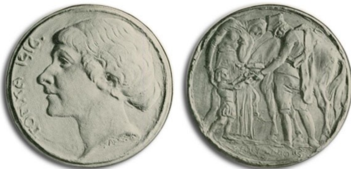
Po lewej: Jednostronny medalion z portretem niezidentyfikowanej niewiasty. Po prawej: projekt pamiątkowego medalionu na rzecz pomocy legionistom polskim w latach I wojny światowej.

R. zaprojektował też odznakę pamiątkową PLEBISCYT ORAWA SPISZ ŚLĄSK 1920 (mosiądz srebrzony, bity, 1920; model: gips, lany, MNK) oraz odznaczenie DOBRZE ZASŁUŻONEMU (model: gips, lany, 1925, MSM). Wg Strzałkowskiego brał udział w konkursach na monety: 1923 (Min. Skarbu) - monety 1 i 2 zł (rewersy: 2 proj. z głową kobiecą, 2 proj. z postaciami chłopki i chłopca; 3 z tychże, wszystkie gips barwiony, lany, MSM); 1924 i 1925 (Min. Skarbu) - monety bite w złocie; 1928 - moneta 1 zł; 1933 (Mennica Państw.) - monety bite w złocie (VI nagroda). Nadto w 1938 uczestniczył w konkursie Mennicy Państw, na proj. monety bitej w złocie (model rewersu: 1 DUKAT 1939, gips, lany, MSM). Wszystkie proj. pozostały niezrealizowane.