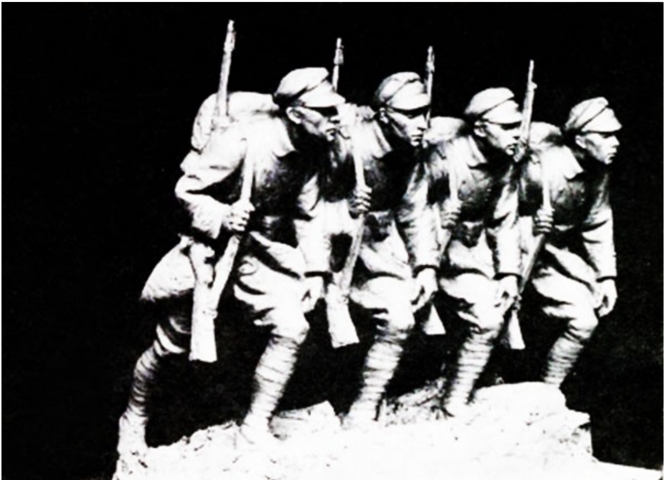
Czwórka legionistów. Rzeźba brązowa z pomnika w Kielcach, 1938.

Cezurę w życiorysie i twórczości R. stanowiły I. I wojny światowej. W 1914 przebywał pod Wiedniem na rekonwalescencji. W 1915 był przewodniczącym komisji dochodowej w wiedeńskiej Gospodzie Legionistów podległej Naczelnemu Komitetowi Opieki. W październiku lub listopadzie t.r. odsłonięto tamże tzw. tarczę legionową wg proj. R. (przeznaczoną do składania podpisów przez darczyńców; następnie - do odlania w brązie) NA GOSPODĘ LEGIONISTÓW 1914-1915, drewno, plastelina,