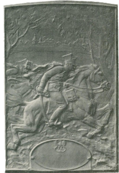
Beliniak. Plakieta brązowa, ok. 1917.

W 1. 20. i 30. XX w. R. tworzył nadal rzeźbę architektoniczną. W 1926 wygrał konkurs na dekorację rzeźbiarską hali targowej, rozpisany przez magistrat Piotrkowa Trybunalskiego; rzeźby wg modeli R. odkuł w Warszawie Zygmunt Otto, kamień, 1927: nad wejściem gł. figura Hermesa (fotografie modelu, gips, w zb. pryw. w Krakowie), nad pozostałymi bramami 3 figury - personifikacje różnych gałęzi rolnictwa, w zwieńczeniu ścian szczytowych 2 rodzajowe płaskorzeźby z herbem Piotrkowa - alegorie „handlu regionalnego” i „handlu międzynarodowego” (M. Omilanowska). W 1927 wygrał konkurs na wystrój gł. klatki schodowej gmachu Urzędu Wojewódzkiego i Sejmu Śląskiego w Katowicach. Zrealizowano 4 płaskorzeźby alegoryczne: Śląsk rolniczy, Śląsk przemysłowy, Śląsk powstańczy (inaczej Powstanie śląskie), Alegoria Województwa Śląskiego, ponadto na fasadzie płaskorzeźbę - godło państwowe ze skrzydlatymi geniuszami (wszystkie zniszczone podczas II wojny światowej; w zb. pryw. W Krakowie fotografie oraz modele, gips: Śląsk rolniczy, Śląsk przemysłowy, Śląsk powstańczy, Godło państwowe, sygn. i dat. 1928). Płaskorzeźby te pokazują ewolucję stylu rzeźbiarskiego R.: relief jest płaski, modelunek oszczędny, figury monumentalne. Te same cechy - ze znacznie większą