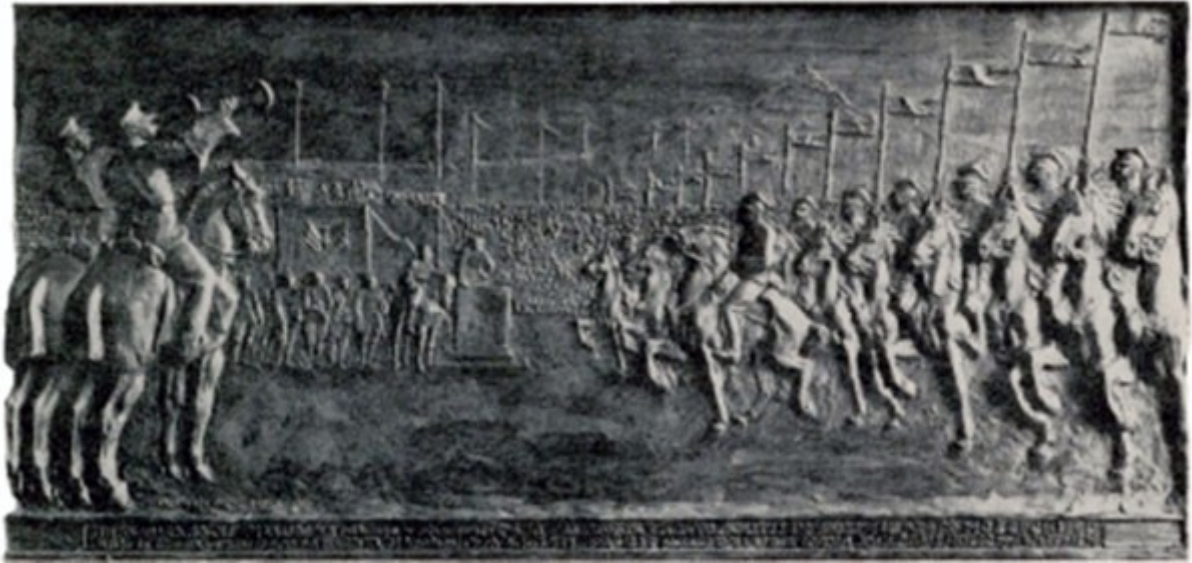
Rewia kawalerii na Błoniach krakowskich. Plakieta brązowa, 1933.