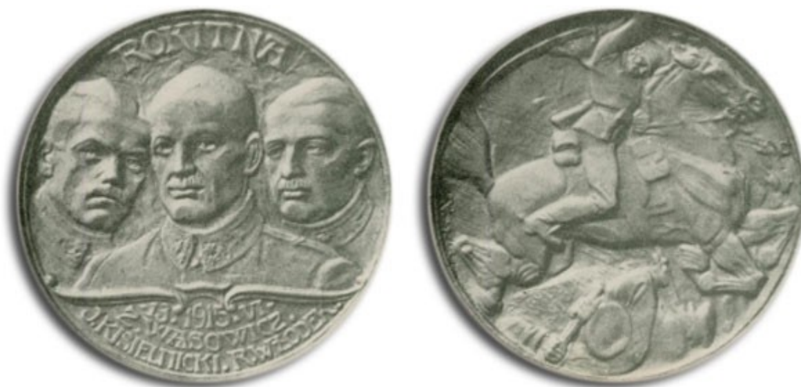
Wydany na pamiątkę szarży Legionów Polskich na pozycje rosyjskie pod Rokitną w 1915 r. Atak prowadzili rtm. Zbigniew Dunin-Wąsowicz, por. Jerzy Topór-Kisielnicki oraz podpor. R. Włodek. Wszyscy polegli. 1915 r.

T. [Tadeusz] KOŚCIUSZKO +15.X.1817/ MCMXVII, egzemplarze: srebro (w dwóch wielkościach), brąz, bite, sygn., 1917 (model awersu: gips, lany, MNK; model awersu: plastelina na płytce łupkowej, MSM, studium do rewersu: rys. oł., MSM); PRZEMYSŁOWI W 900NĄ ROCZNICĘ ODZYSKANIA PRZEZ CHROBREGO/ W CZAS WIELKIEJ WOJNY TOW. PRZYJACIÓŁ NAUK 1918, proj. 1918, odbity 1925, egzemplarze: srebro, brąz, bite, sygn. (3 modele w większej skali: gips, sygn., MN Ziemi Przemyskiej Przemysł); NA PAMIĄTKĘ OSWOBODZENIA KRAKOWA OD ZABORCÓW 31 PAŹDZ. 1918, egzemplarze: srebro, brąz, brąz złożony, bite, sygn., 1918 (model rewersu: gips, lany,