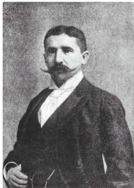
Jan Chełmiński (1851-1925), fotografia z ok. 1894 roku

Jan Chełmiński był malarzem związanym ze środowiskiem monachijskim, którego twórczość znana i ceniona była zarówno w Europie, jak i w Stanach Zjednoczonych, gdzie ostatecznie artysta ten osiadł na stałe. Tworzył dużo, malował sprawnie, a drobiazgowo studia ubioru, munduru, końskiej uprząży, widoczne w obrazach przyniosły artyście sławę i szerokie grono kolekcjonerów jego prac. Urodził się w 1851 roku w Brzustowie koło Opoczna w rodzinie nadleśniczego Lasów Rządowych. Przejawiając zainteresowania artystyczne, w latach 1866-1868 kształcił się w Klasie Rysunkowej Wojciecha Gersona w Warszawie i pobierał lekcje w pracowni Juliusza Kossaka. Równocześnie pracował jako litograf i retuszer w jednym z warszawskich zakładów fotograficznych. W latach 1873-1875 studiował w Królewskiej Akademii Sztuk Pięknych w Monachium. Uczęszczał do pracowni malarza historycznego Alexandra Strähubera (gdzie studiowali też Wojciech Kossak, Jan Rosen, Julian Fałat, a wcześniej – bracia Maksymilian i Aleksander Gierymscy) oraz do pracowni prowadzonej przez Alexandra Wagnera. Profesor Wagner prowadził pracownię malarstwa historycznego przez ponad czterdzieści lat, na jego kursy