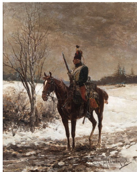
Jan Chełmiński (1851-1925) „Huzar napoleoński”, 1888 rok