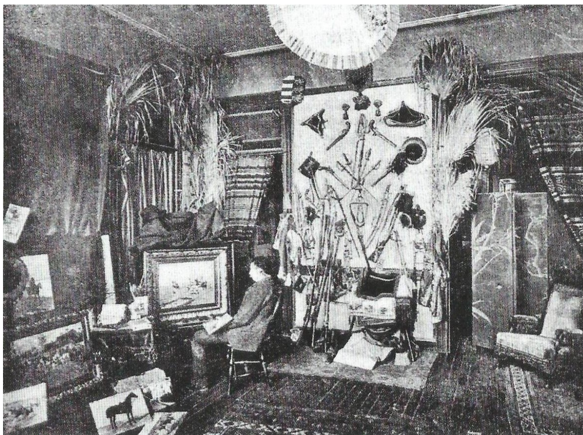
Pracownia Jana Chełmińskiego, fotografia z ok. 1894 roku, źródło: Tygodnik Ilustrowany

uczęszczała większość polskich malarzy, którzy w tym czasie zdobywali wykształcenie w akademii monachijskiej.