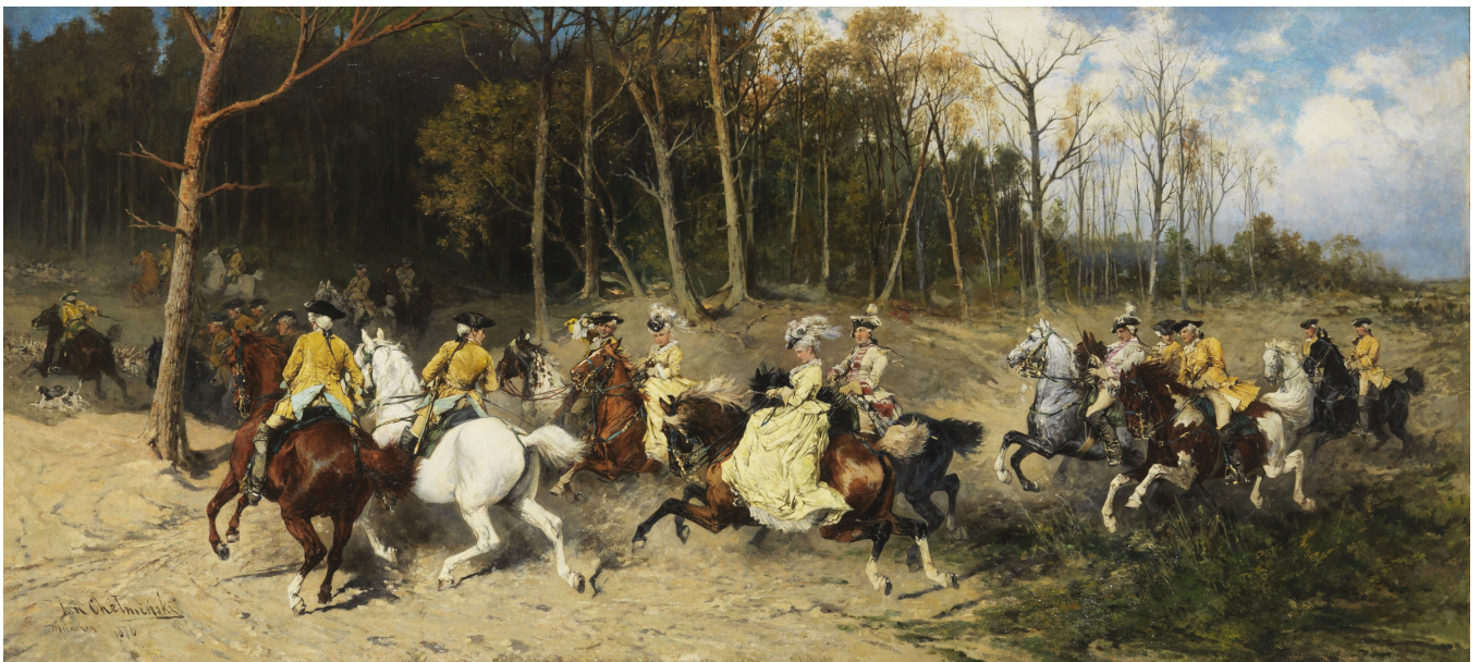
Jan Chełmiński (1851-1925) „Polowanie par force”, 1876 rok

Chełmiński, podobnie jak wielu jego kolegów malarzy, łączył studia w akademii z nauką w prywatnych atelier malarskich. W roku 1875 kształcił się w pracowni prowadzonej przez Józefa Brandta, a w kolejnym roku uczęszczał do atelier Franza Adama, batalisty i świetnego malarza koni, przez którego pracownię przeszli wcześniej tak uznani twórcy, jak Józef Brandt i Juliusz Kossak. Od początku swojego pobytu w Monachium Chełmiński odnosił sukcesy artystyczne, a jego kompozycje rodzajowe sprzedawały się doskonale.