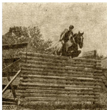
Klacz Heatherbloom XX w skoku na wysokość 2 m 44 cm (Teksas 1902 r.)

Przypomnij my, że oficjalny rekord Polski w skoku na wysokość wynosi 2,05 m. Ustanowił go w roku 1969 na zawodach w Radomiu Wiesław Dziadczyk dosiadający klaczy Via Vitae xx. Również w 1969 r. na zawodach CHIO w Olsztynie para ta w konkursie potęgi skoku pokonała mur wysokości 2,20 m. Skok ten jednak nie mógł być uznany za rekord Polski, gdyż nie odpowiadał wymaganym warunkom.