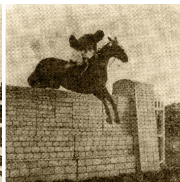
Wiesław Dziadczyk na klaczy Via Vitae skacze 2 m 20 cm.