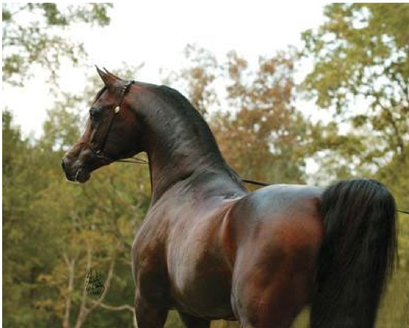
Gazal Al Shaqab (Anaza El Farid - Kajora / Kaborr)

dzierżawiony w latach 2002 i 2003. Używany w macierzystej stadninie (zostawił w SK Michałów: Diasporę, Drzewice, wróżkę, Złotą Księżę, Zulejkę i inne), Janowie, gdzie zostawił stawkę bardzo dobrych klaczy, świetnie rodzących oraz NicholsArabians i Canterbury Farm, USA. Tak jak Ekstern ojciec klaczy. Ekstern i Ganges do dzisiaj w macierzystej stadninie, w świetnej formie, obaj skończyli 21 lat w 2015 roku.