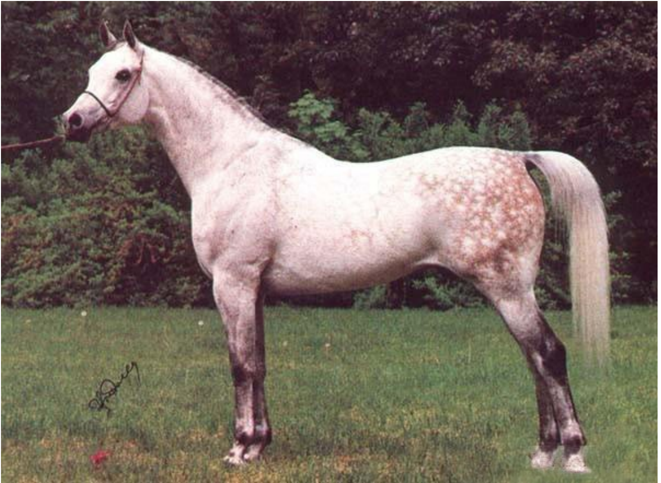
Pamir ( Probat - Parma / Aswan ex Raafat)