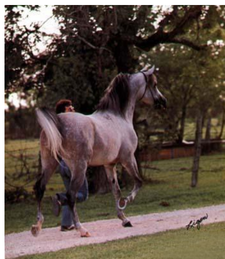
Piechur (Banat - Pierzeja / Bandos)