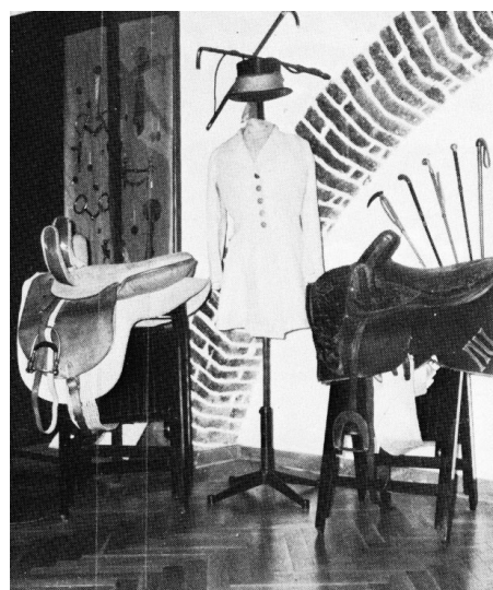
Niektóre eksponaty: dwa siodła do siedzenia po damsku, strój amazonki: w głębi gablota z wędzidłami i munsztukami.