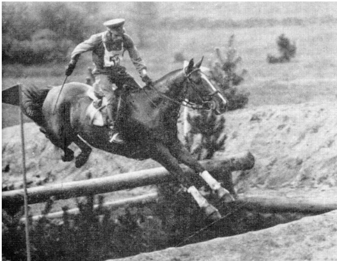
J. Horwath (Węgry) na koniu Dariusz na trasie crossu podczas CCI w Białym Borze