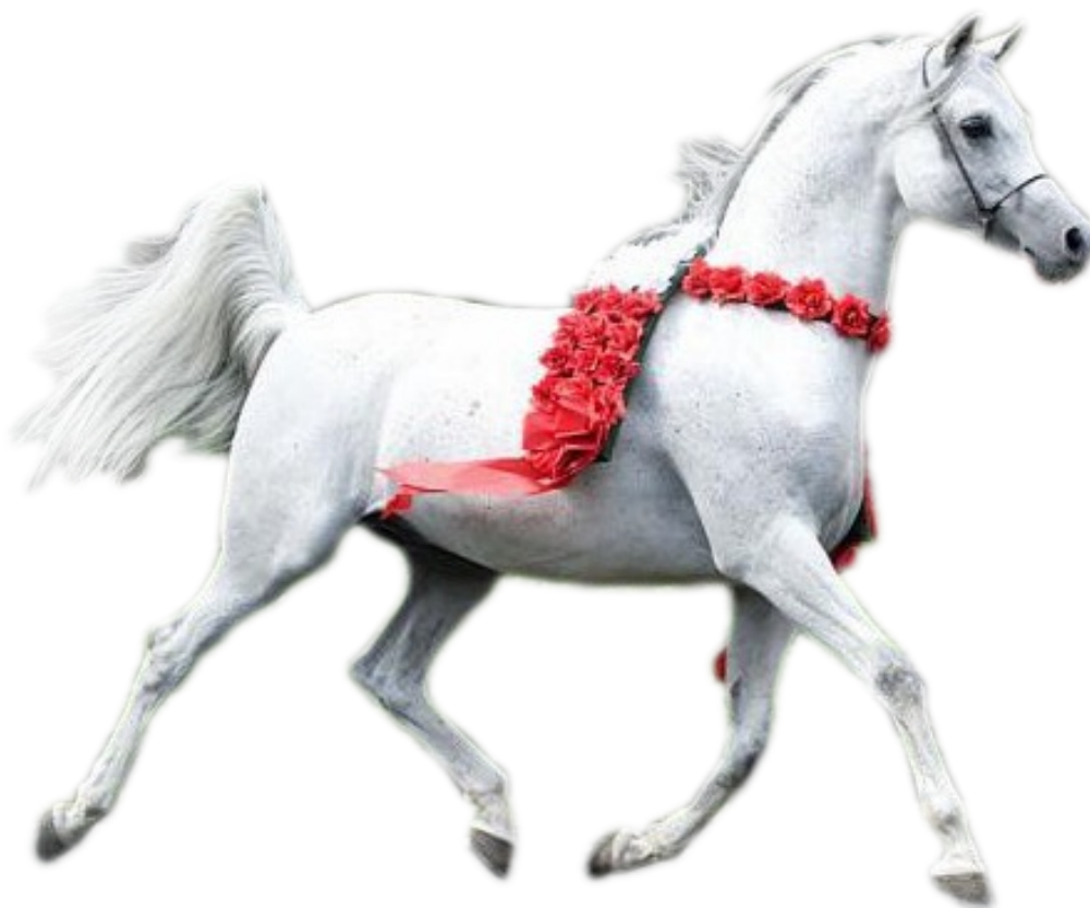
og. Ekstern oo (Monogramm-Ernestyna), hod. SK Michałów, 01.10.1994 – 25.04.2022.