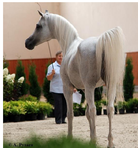
Ekstern - 2015.

Pomimo tylu lat Eksternowi nie udało się pozostawić godnego następcy, kontynuatora tego niezwykłego rodu, który by wyraźnie zaznaczył swoje miejsce na scenie hodowlanej. Pokładano nadzieję w najlepszym jego synu, za jakiego uchodził og. Esparto (Ekstern – Ekspozycja/Eukaliptus), który był dwukrotnym Młodzieżowym Czempionem Polski, Czempionem Polski Og. Starszych 2009 roku, Czempionem Og. Starszych z Wells, Wicczempionem Pucharu Narodów Og. Starszych z Aachen oraz Wicczempionem Europy w Morsele – Belgia.